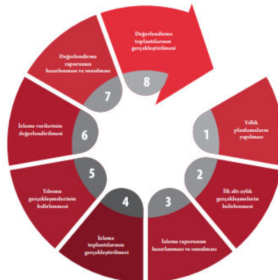
Şekil 4: İzleme ve Değerlendirme Süreci